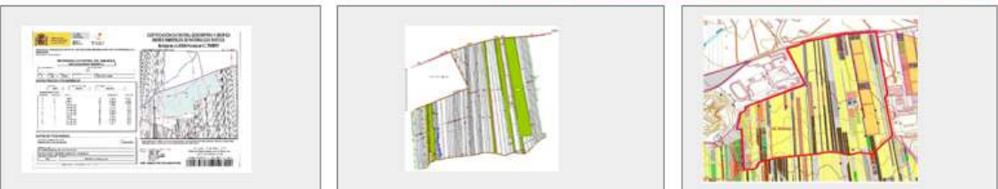
5.2 - Titularidad Catastral 5.3 - Parcelas y subparcelas 5.4 - Usos: suelo y edificación